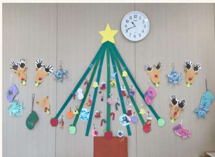
子供たちが作ったクリスマスツリー🎄