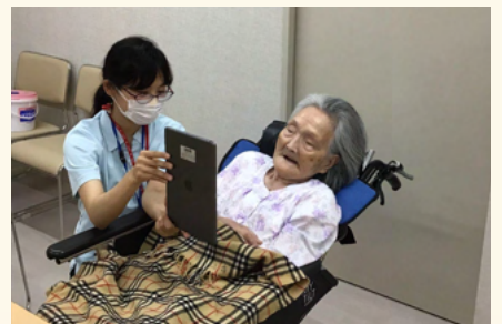
新人生活相談員奮闘中！