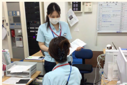
お互いに進捗を報告中