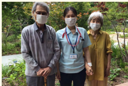
利用者さんと敷地内をお散歩